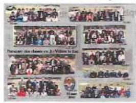
Le groupe 24 x 30 cm 12 €