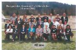
La classe 18 x 24 cm 8 €

Pour immortaliser cette journée, nous vous proposons deux formats de photos :